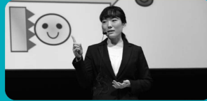
2019年大会@くらは大ホール 最優秀賞受賞者